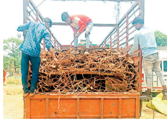
पुलिस गिरफ्त में जप्त वाहन एवं कबाड़।

हरिभूमि न्यूज ►► कोरबा सिविल लाइन रामपुर पुलिस की टीम को पेट्रोलिंग के दौरान मुखबि