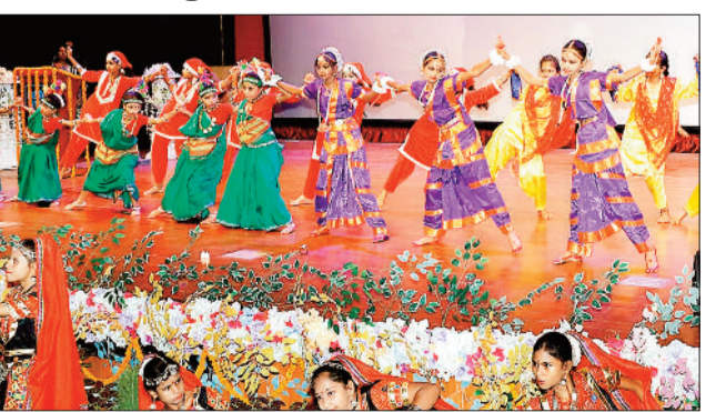
कार्यक्रम की प्रस्तुति देती बालिकाएं।

एनटीपीसी कोरबा ने वर्ष 2019 में पहली बालिका सशक्तिकरण अभियान का आयोजन किया, जो युवा बालिकाओं को सशक्त बनाने के लिए एक अटूट प्रतिबद्धता की शुरुआत को दर्शाता है। यह दूरदर्शी कार्यक्रम समाज के उत्थान के लिए एक प्रतिबद्धता है, और यह अपनी शुरुआत से ही देश में 10 हजार 104 और जिले में 492 लड़कियों के सपनों को पूरा कर रहा है। बालिका सशक्तिकरण मिशन 2024 (जीईएम) की महीने भर की आवासीय ग्रीष्मकालीन कार्यशाला का समापन करते हुए, एनटीपीसी कोरबा ने 19 जून को समापन समारोह का