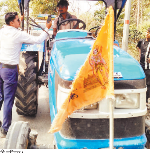
कार्यवाही करती पुलिस।