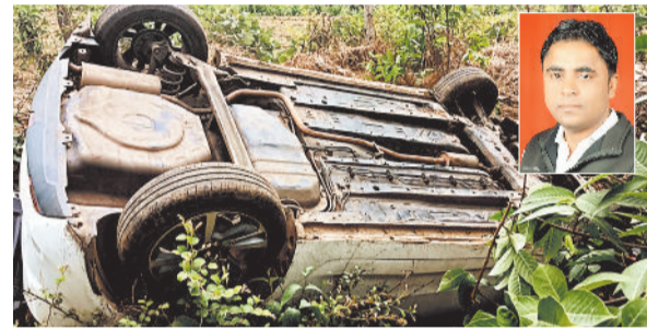
दुर्घटनाग्रस्त कार एवं इनसेट में मृतक।