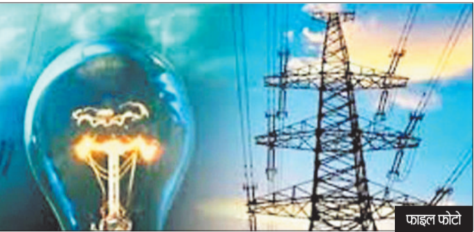
हरिभूमि न्यूज ►► कोरबा

वेसे तो कोरबा ऊर्जा नगरी है, बावजूद इसके उपभोक्ता बिजली की आंखमिचौली से खारे परेशान है। शहर में आए दिन बिजली सप्लाई में बाधा आ रही है जिसका खामियाजा लोगों को उठानी पड़ रही है। वही उपभोक्ता हर रात को किसी भी टाइम बिजली चले जाने से परेशान है। एक तो गर्मी की मार ऊपर से बिजली गुल होने की शहरवासी खासे आक्रोशित है। इस संबंध में शहरवासी सोशल मीडिया पर जमकर गुस्से का इजहार कर रहे हैं। हालांकि लोगों को विभाग के कर्मचारियों से भी शिकायत है। कहने को वितरण विभाग के अधिकारी कर्मचारी 24 घंटा ड्यूटी में